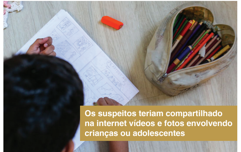
Os suspeitos teriam compartilhado na internet vídeos e fotos envolvendo crianças ou adolescentes